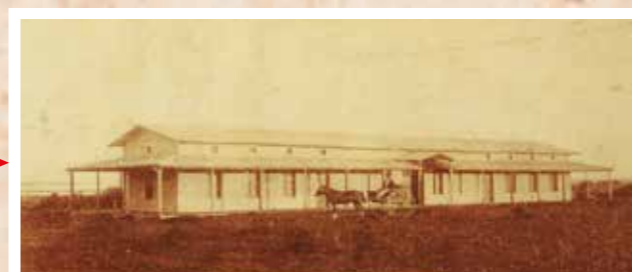
Antiguo Hospital de Caridad (hoy Hogar Santa Teresita).

Poco después de su arribo fue iniciado masón en la Logia Roque Pérez de la Trinchera de San José.